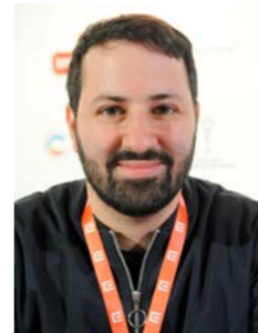
Ofir Raul Grazier

Návštěvníci festivalu KOLNOA budou mít možnost setkat se s režisérem snímku Cukrář Ofirem Raulem Graizerem i představitelem hlavní role Timem Kalkhofem. První dva dny festivalu, ve čtvrtek 19. a v pátek 20. října, bude vždy po projekci filmu Cukrář vyhrazen prostor pro besedu s oběma tvůrci.